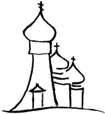
Rys. 2. Cerkiew prawosławna

Dodatek dla młodszych nr 17 (styczeń 2014)