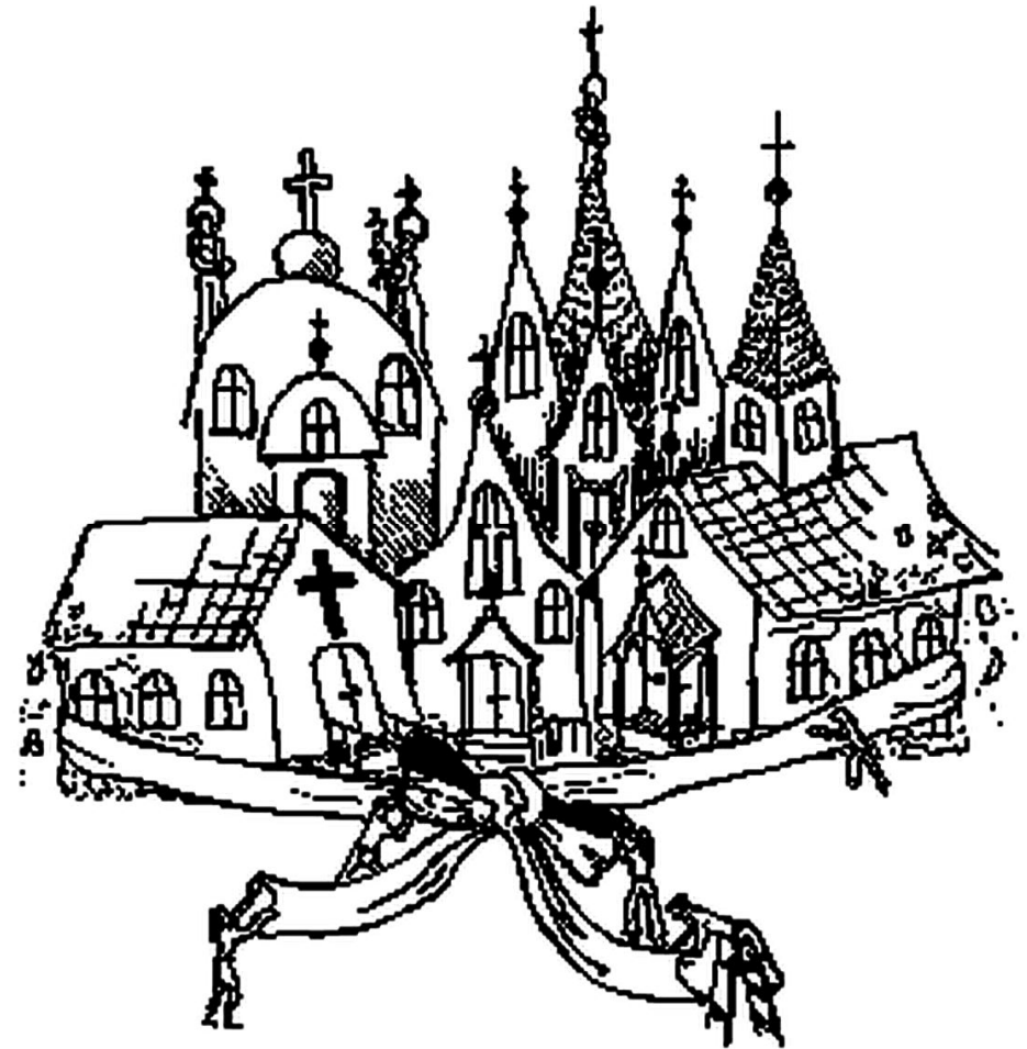
Rys. 1. Ekumenizm