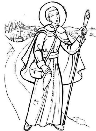
zdjęcie o charakterze