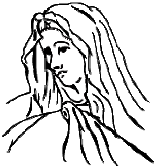
Rys. 2. Matka Boża Bolesna

Prawda rymowana... Józef z Marią Dziecię wzięli, Gdyż Bogu oddać je chcieli W świątyni – prorocka mowa Symeona padły słowa: „Twoją duszę miecz przebije”, Tak starzec ostrzegł Maryję. Po latach Matka spłakana Wzięła Syna na kolana Przytuliła Jego ciało, Które na krzyżu wisało. Boleść serca matczynego Patrzeć na śmierć syna swego. Matko Boża Bolesciwa, Pełna cierpień, miłościwa, Mario, Panno nad pannami Wstawiaj ciągle się za nami.