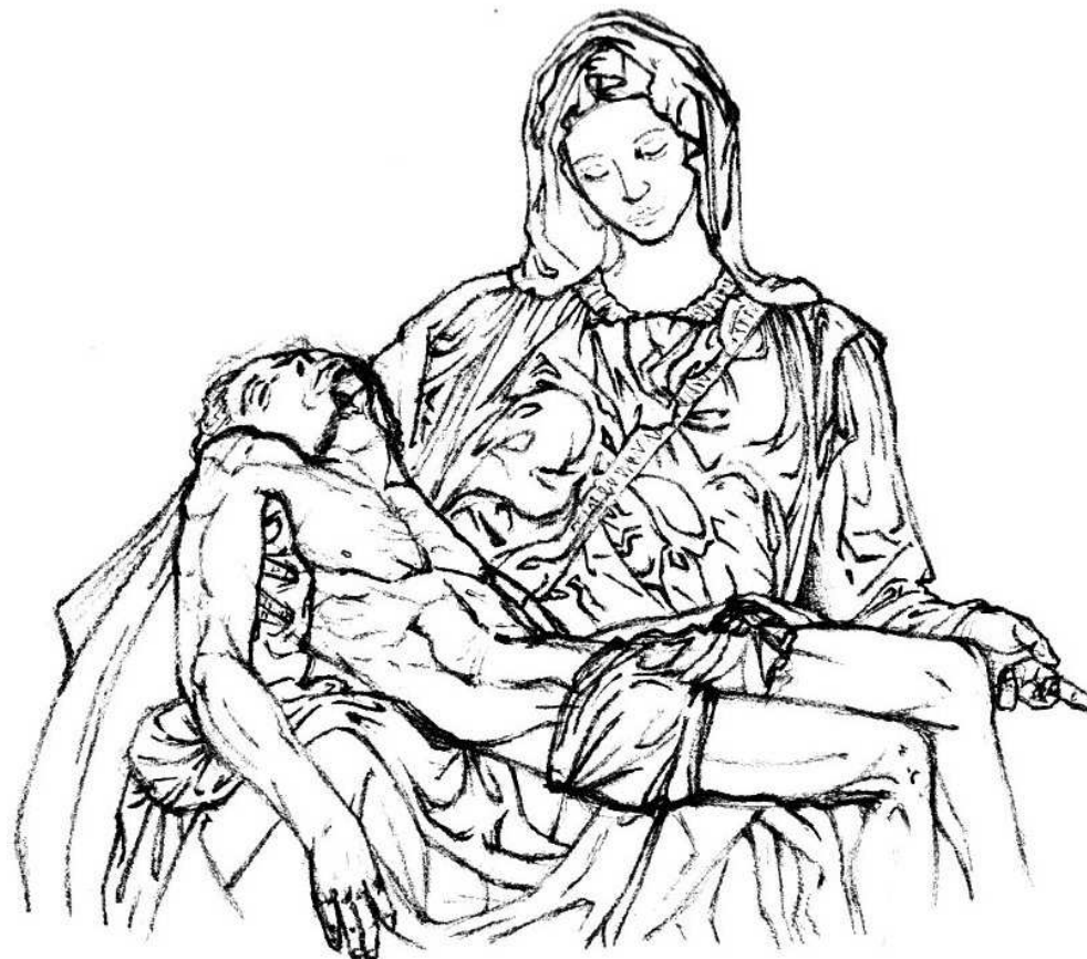
Rys. 1. Pieta