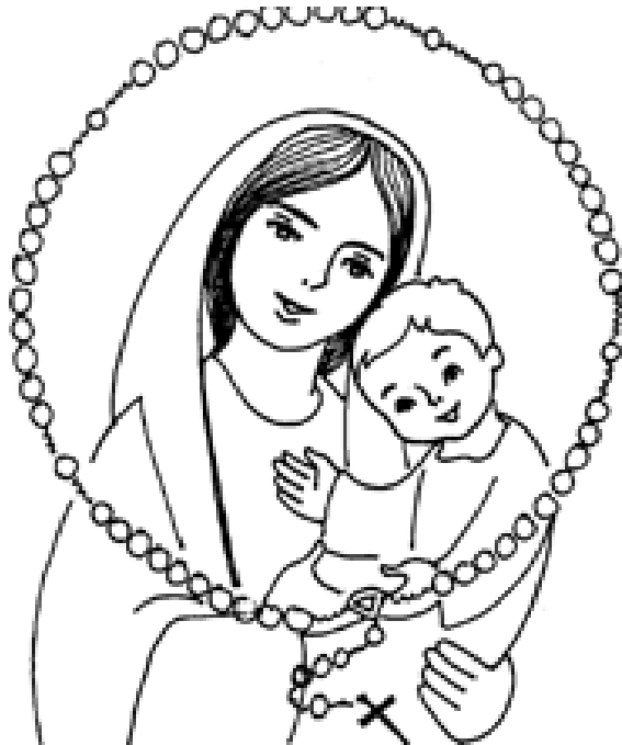
Rys. 3. Maryja z Dzieciątkiem