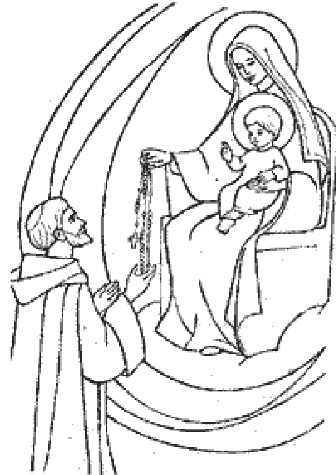
Rys. 1. Niepokalana ofiarowuje różaniec